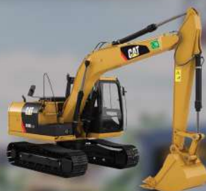
รถแบคโฮ BACKHOE TRACTOR