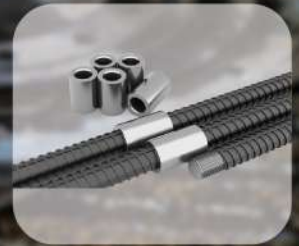
REINFORCING BAR COUPLERS

มุ่งเน้นผลิตภัณฑ์จากเหล็ก เพื่อตอบสนองและรองรับอุตสาหกรรมการก่อสร้าง ด้วยเครื่องจักรที่ทันสมัย ที่มีการทดสอบและบำรุงรักษาเครื่องจักรอย่างสม่ำเสมอ พร้อมทั้งควบคุมการผลิตด้วยระบบ CNC ที่มีความแม่นยำสูง ได้คุณภาพและรวดเร็ว ได้ปริมาณที่มากในระยะเวลาที่น้อย ผลิตและควบคุมคุณภาพการตรวจสอบทุกชิ้นงานด้วย แผนก QC ก่อนการจัดส่งให้ลูกค้า เพิ่มความมั่นใจในคุณภาพของผลิตภัณฑ์ให้กับลูกค้า