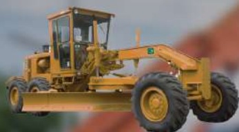
รถเกรดเดอร์ GRADER