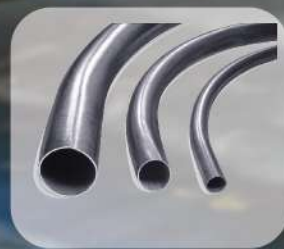
PIPE CUTTING BENDING SERVICE