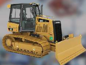
รถแทรกเตอร์ TRACTORS